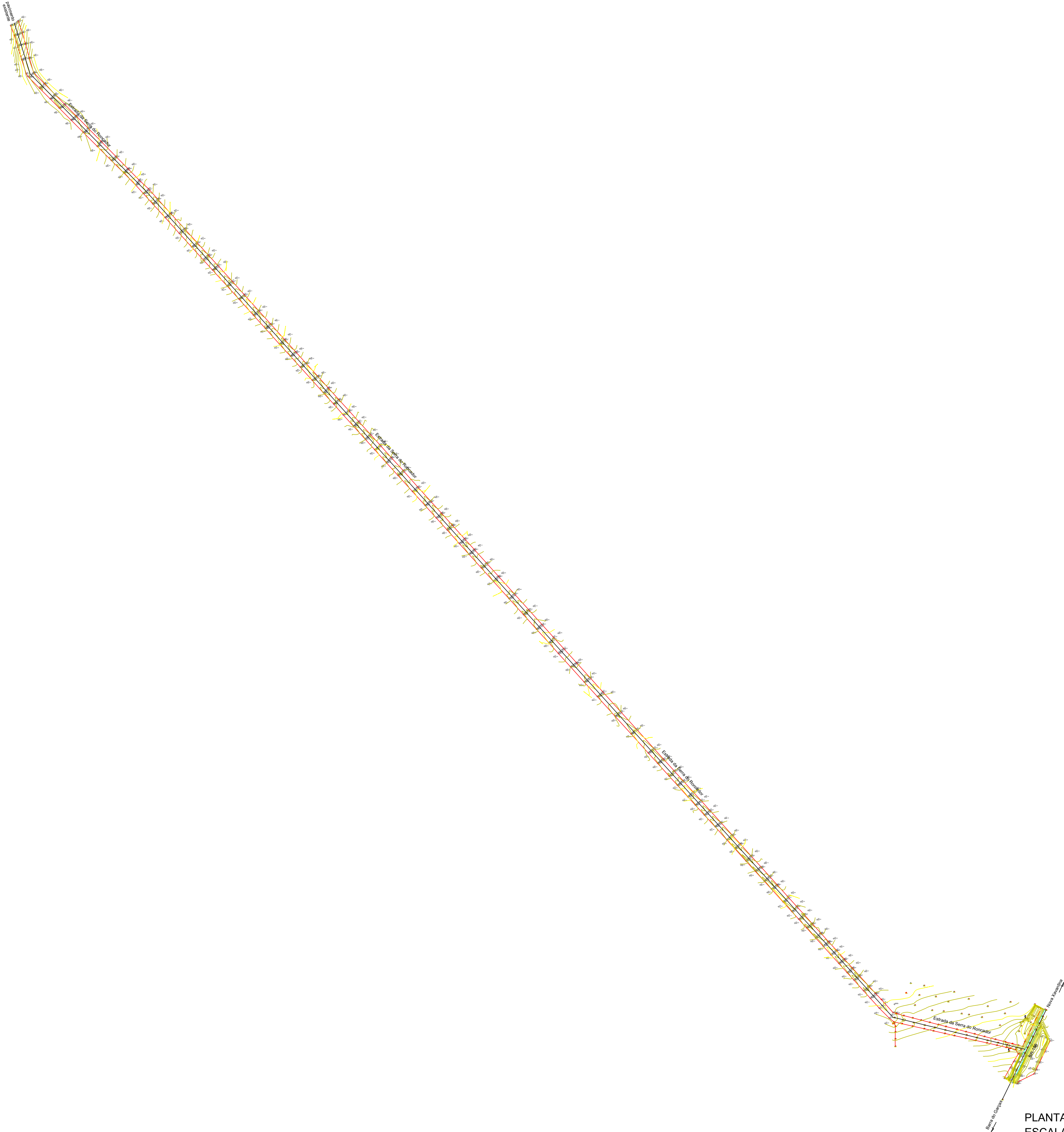
PLANTA DE PLANALTIMÉTRICO ESCALA 1/4.500